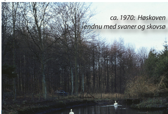
ca. 1970: Høskoven endnu med svaner og skovsø