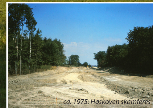
ca. 1975: Høskoven skamferes