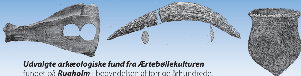
Udvalgte arkæologiske fund fra Ærtebøllekulturen fundet på Rugholm i begyndelsen af forrige århundrede.