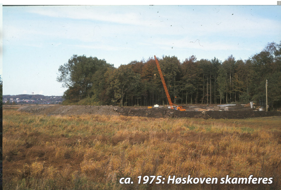
ca. 1975: Høskoven skamferes