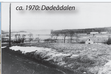
ca. 1970: Dødeådalen