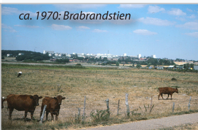
ca. 1970: Brabrandstien

Sædvanen tro vil der blive fortalt om området, som tidligere har tilhørt de to Vibygårde, Nordbygård og Søgård, og noget af det, vi går forbi, heriblandt at man for ca. 110 år siden fandt et stort oldtidsfund på Rugholm.