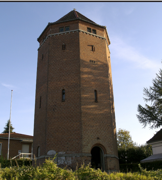
Vi fik lov at se vandtårnet både ude og inde .....