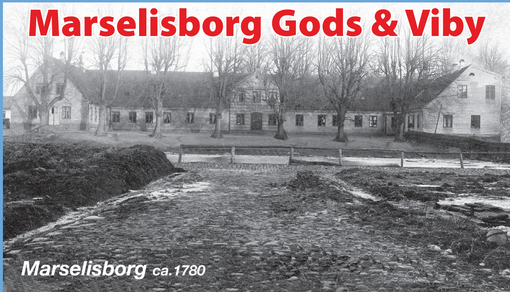
Marselisborg ca. 1780