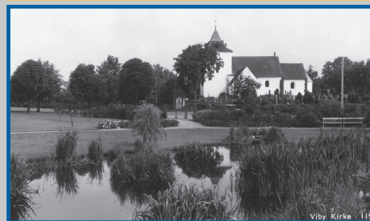
Viby Kirke 1194