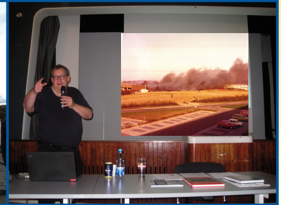
Harbøre kirke 25. september 2018