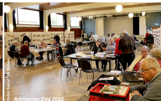
Arkivernes Dag 2022