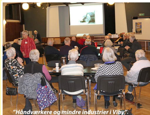
"Håndværkere og mindre industrier i Viby"