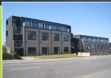
Nye bebyggelser Chr. X's Vej