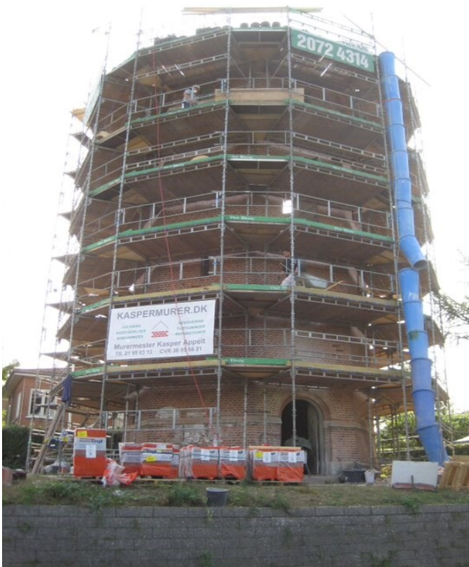
Ombygning 2016.

Vi mødes kl. 18.30 ved det gamle vandtårn på Terp Skovvej/Stenhøjsvej 2a. Vi stiger op i tårnet i grupper på 6-8 personer, mens resten venter nedenfor. Info om Vandtårnet på sidste side. Kl. ca 19.30 mødes vi med en repræsentant for AGF, som vil vise os rundt i de nye lokaliteter, og bagefter er foreningen som sædvanlig vært ved en øl eller vand. Der skulle være parkeringsmuligheder på Terp Skovvej.