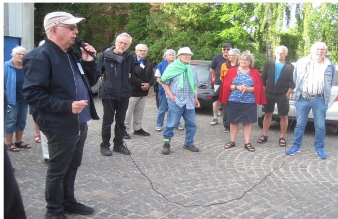
Byvandring Bjørnholms Alle. Formanden byder velkommen.