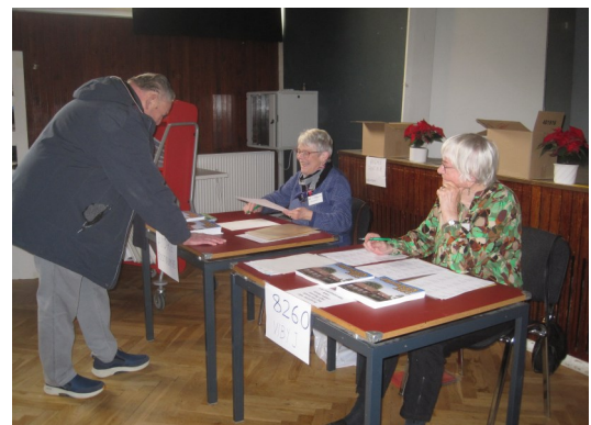
Fra Arkivernes Dag og Bogudlevering 2023