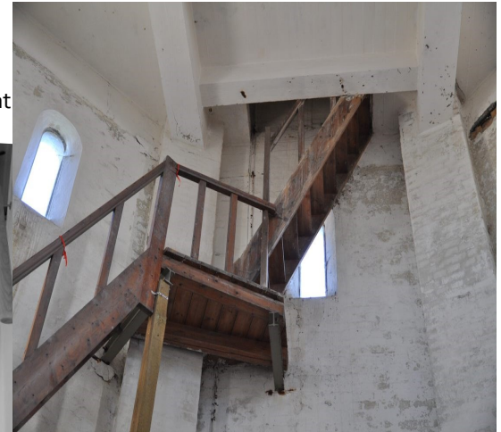
Oprindelig trappe. Foto fra Byvandring 2014.