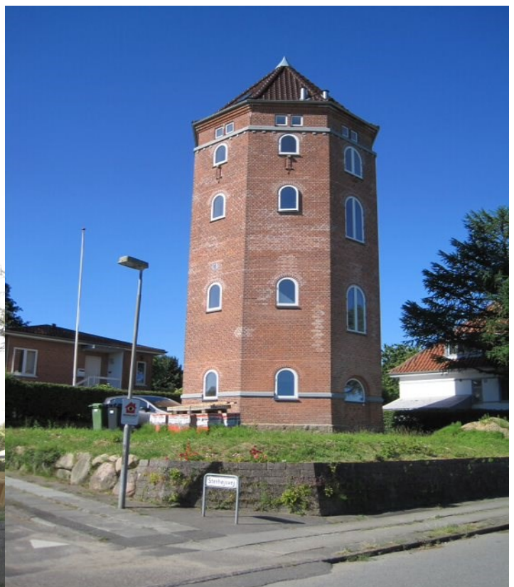
Færdig ombygget 2018.