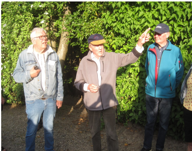
Byvandring Bjørnholms Alle. Fortælling om kolonihaverne fra stien ved Hammelbanen..